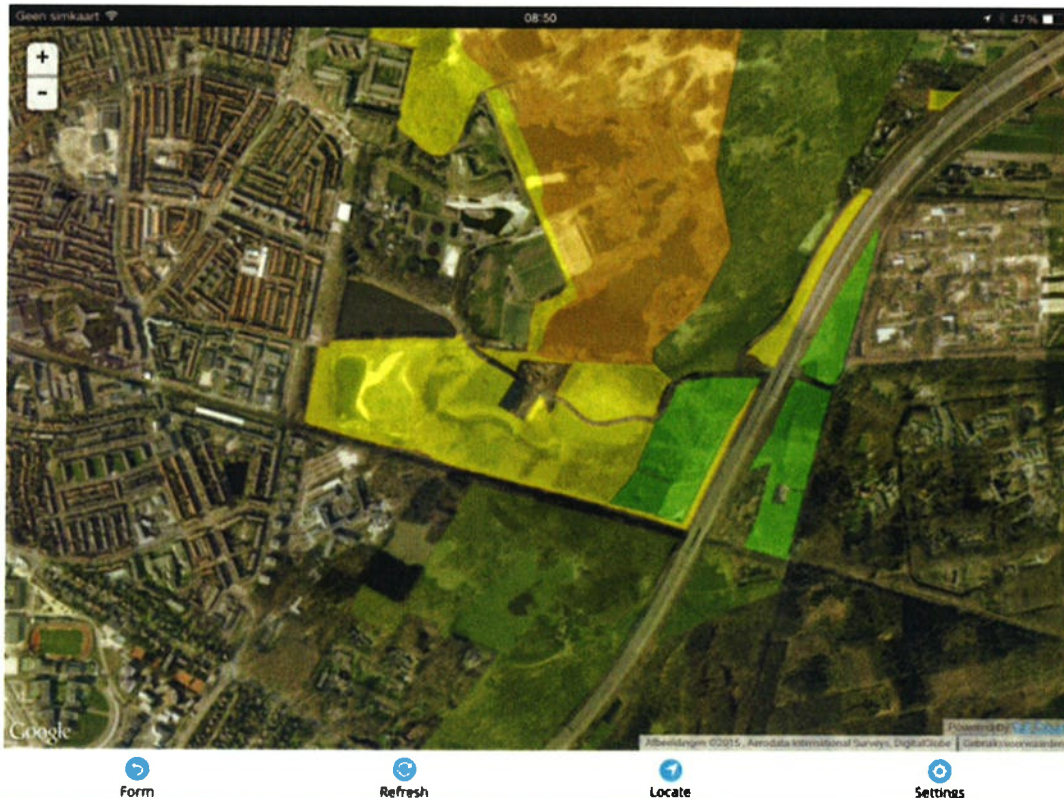
Figuur 2. Toegangsbepalingen van Anna's Hoeve en hier ten noorden van gelegen (natuur)gebied in beheer bij het GNR. Geel staat voor honden losloopgebied, in het lichtgroene (oostelijke) deel geldt een aanlijnplicht tussen 15 maart en 15 juli.

Het risico van wandelaars met hond op het functioneren van De Groene Schakel achten wij terecht. Onderzoek naar het ecologisch functioneren van ecoducten door Bureau Waardenburg (waaronder ecoduct Huis ter Heide; Emond & Brandjes, 2015) laat zien dat wandelpaden in de periferie van een ecoduct per definitie leidt tot een sterke toename van 'ongewenst medegebruik'. Met uitzondering van ree en konijn, die het ecoduct frequent passeerden/gebruikte, was de passeerfrequentie van overige zoogdieren relatief laag (waaronder boommarter). Bij Huis ter Heide was wel een verschuiving in het activiteitenpatroon van het ree zichtbaar, en beperkt tot de nachten. Dit in tegenstelling tot andere ecoducten (JP Thijsse, Nijverdalen etc.) waar reeën ook overdag actief waren om te foerageren. Het ambitieniveau van de doelsoort 'heidevogels' zal niet gehaald worden indien de huidige recreatiedruk (aantal en vorm) gehandhaafd blijft; voor deze soortgroep hebben wandelaars ook een verstoringseffect. Alleen wanneer de huidige recreatiedruk wordt teruggebracht kan de corridor fungeren als leefgebied voor deze groep.